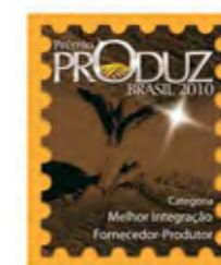
Categoria Melhor Integração Fornecedor - Produtor